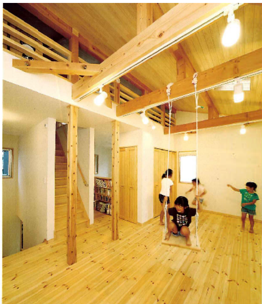
2階のフリールームにはフランクを梁からさげ、子どもたちの遊び場にも。上階のロフトとの繋がりもあり、上下階でボールを投げ合ったり遊んだり、ノビノビと過ごせる空間に（写真はすべて千葉県F氏邸）