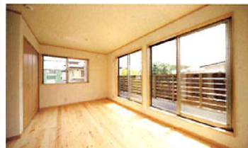
リビング上部の一番日当たりの良い場所に配置された居室。2部屋に区切って使用することもできる