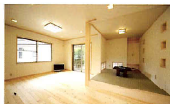
和室の窓はあえて下窓タイプに。明るいリビングと落ち着いた和室とで違った表情を見せてくれる