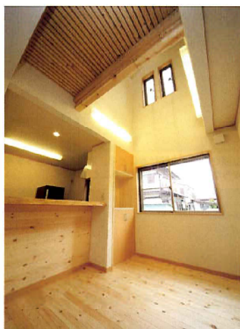
ダイニングの上部を吹き抜けに。光が吹き抜けを通して1階に差し込み、東側のダイニングも明るい