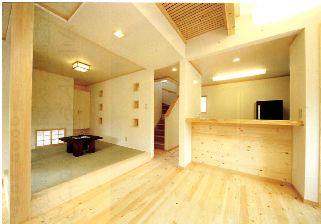
壁は珪藻土、床材は無垢の赤松に蜜蝋ワックス、柱には杉を使用。気持ちの良い天然素材に包まれる。小上がりの畳スペース、和室壁面の飾り棚などディテールも凝っている。和室に置いた火鉢付きテーブルはKさんお手製。杉の板と柿波の塗料を使うなどインテリアも天然素材