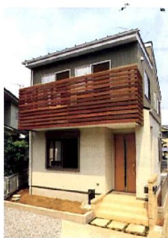
変形敷地に建っているとは思えない、きれいなスクエアの外観

《設備・仕様》 キッチン/タカラスタンダード バス/INAX トイレ/TOTO 洗面化粧台/オリジナル フッシュ/システム 視層ガラス 屋根材/ガルバリウム鋼板 外壁材/ニチハ サイディング 床材/無垢赤松