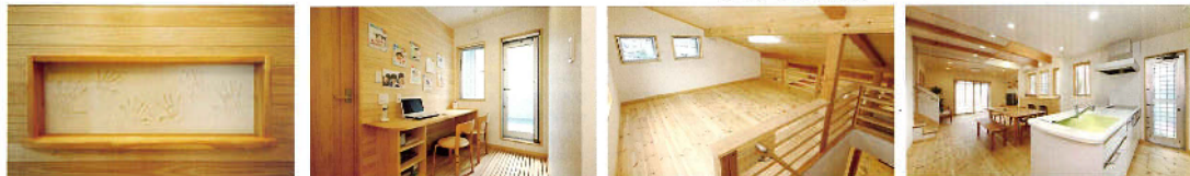
2階のフリールームに増設した書斎。家族みんなのパソコンスペース、雨の日の洗濯機干場として使用 2階フリールームから繋がるロフト。勾配天井で広々とした空間。多目的に使用することが出来る