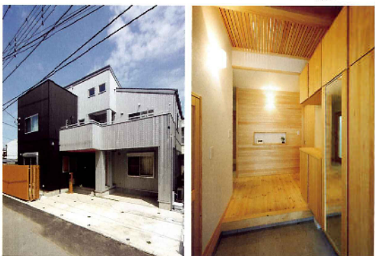
ガリバリウムのクールな外観ながらも、外周や玄関天井に木を配しているなど、室内との連続性を図った