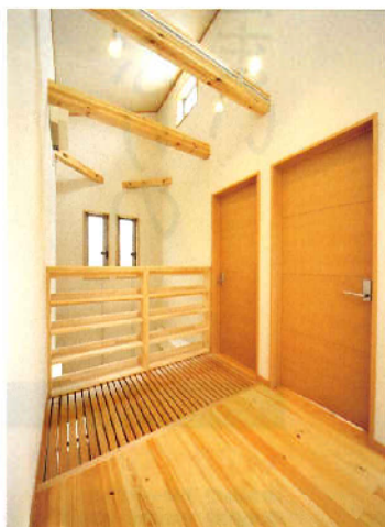
光を少しでも多く1階に届けるためにスノコ状にした廊下の床。吹き抜けには現しにした檜の梁