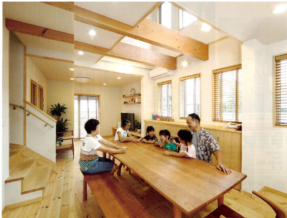
赤松の無垢材、立派な梁が印象的ダイニングとリビングルーム。天然木の室内空間に合わせてダイニングテーブル、ベンチ、ソファもすべて無垢のチェリー材を使用。壁はすべて珪藻土。蒸し暑い夏もサラリとした空気に包まれていた（写真はすべて千葉県F氏邸）