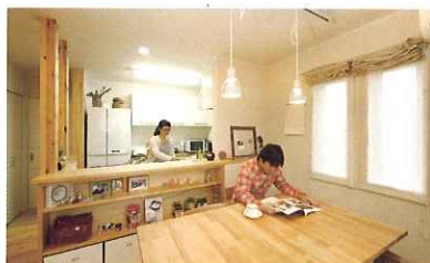
仲よし夫妻にぴったりのオープンキッチン。友達が集まることも多く、入居直後は鍋パーティーを開催