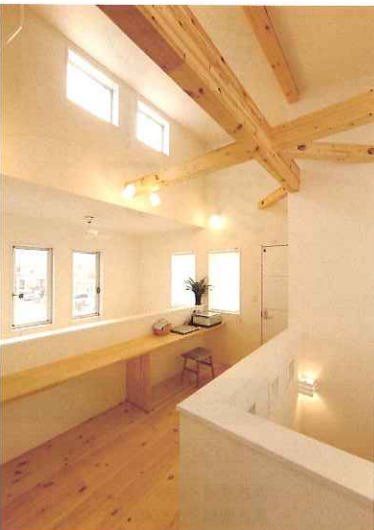
引き抜け横のワークスペース。「全体が繋がっている」ので1階の電気をつけると家中明るくなります」