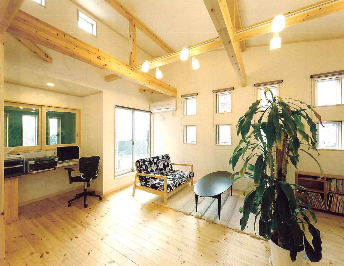
2階に設けた家族用のリビングルーム。1階同様、2階もすべてバインの無垢材を床に使用。吹き抜けを通して1階との繋がりも感じられるので、家全体を見渡せる安心感がある。小さな窓をたくさん付けたのは「遊び心のあるワクワクする家にしたかった」という夫妻のこだわり（このページの写真はすべてT氏邸）