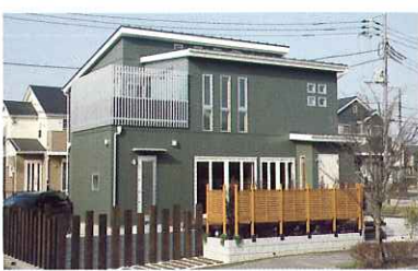
カフェのオープンを前提に設計したため、玄関は2カ所に。お客様用自転車置き場も設置した