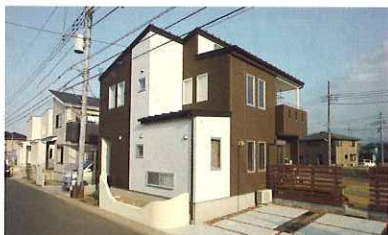
外構も含めて同社に依頼。「一つ決める度に金額を更新してくれて、予算管理がしやすいかったです」