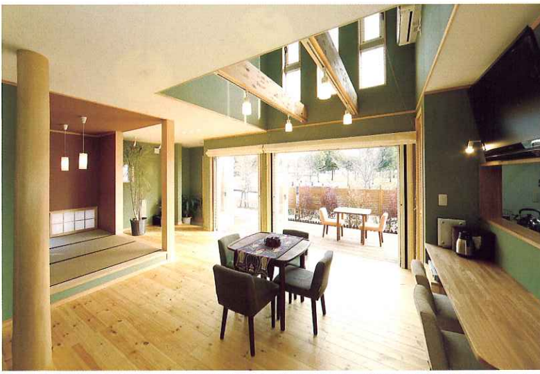
「ありきたりの家になんか嫌だった」というTさんは壁紙もひと工夫。落ち着いたグリーンがアクセントに「木や自然素材をたくさん使った、別荘のような家が理想だった」というT氏邸のリビングルーム。床材はすべて無垢のバイン材。吹き抜け部分の梁を大胆に現わし、開放感と清涼感溢れる空間に仕上がった。「カフェ巡りが大好き」という夫人は、1階で中国茶のカフェをオープンさせる予定（写真はT氏邸）