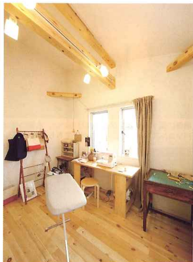
布小物作家の夫人が利用する作業部屋。作業台はYさんのお手製。夫妻ともにモノづくりが得意