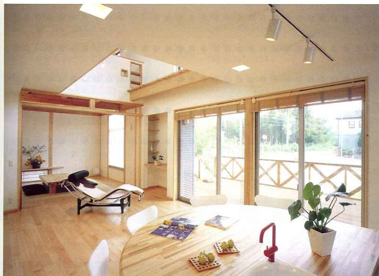
大きな吹き抜け、ウッドデッキ側の大開口部から優しい陽射しが差し込むリビングルーム。天然素材を活かす次世代断熱工法「デコスドライ断熱工法」を採用した清涼感溢れる空気環境にも注目