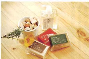
ご来場者には、天然素材から作られたせっけんや吸湿性のある珪藻土の石を、もれなくプレゼント