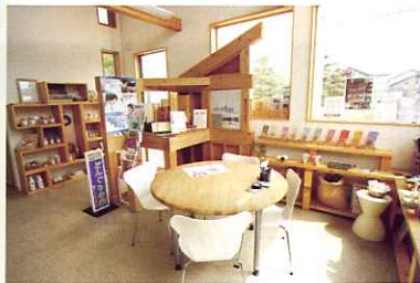
「どんぐりの家」に隣接する本社でも、蜜蜂ワックスや珪藻土など天然素材の建材を展示販売