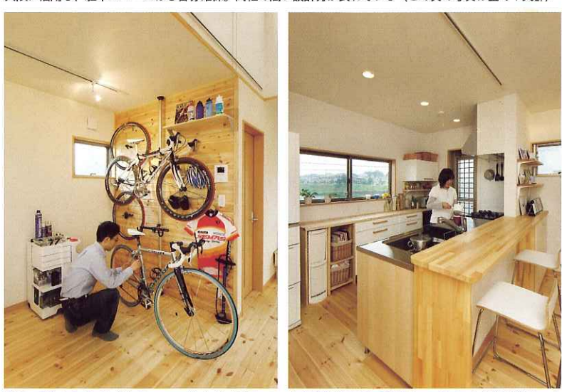
「田園風景が望める窓をキッチン」を条件に設計。カウンター越しに外を眺めながら食事をしているそう