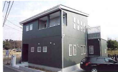
リズムカルに配された窓が印象的な外観。「窓の大きさや形、位置など見え方にもこだわりました」