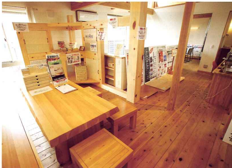
2階に設けられた打ち合わせスペース。天然木のサンプルや、7寸角の木曾ヒノキの構造材など実際に使われる木を確認できるのでイメージが湧きやすい。珍しい木製らせん階段も展示中