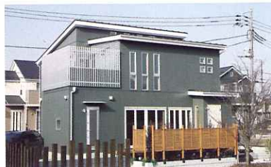
カフェのオープンを前提に設計したため、玄関は2か所に。お客様用自転車置き場も設置した