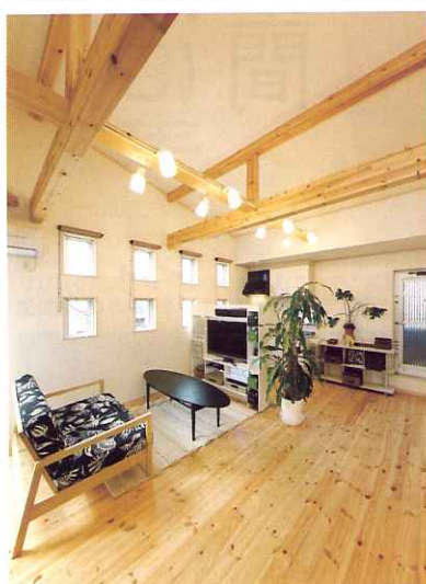
2階に配置した家族用のリビングルーム。小さな窓をたくさん設け、遊び心のある空間を創造した