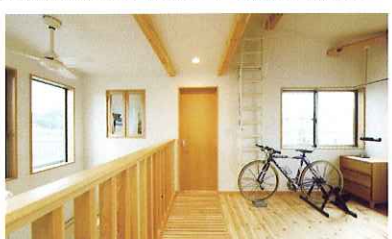
グッドリビングの提案で吹き抜け上部の空間を開放的なホビースペースに。床の一部はスノコ状に