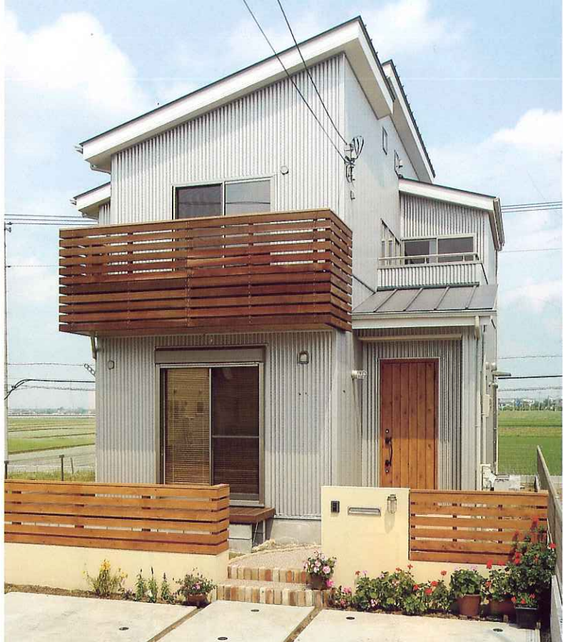
薄いグレーのガルバリウムとバルコニーや外構の木質感のコントラストが印象的な外観。限られた敷地を最大限に活用し、駐車スペースは3台分確保。同社の高い設計力が表れている（この頁の写真は全てT氏邸）