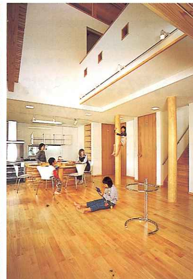
床材だけでなく、丸柱、天井材にも天然木がふんだんに。素足で過ごすのが一番心地よい