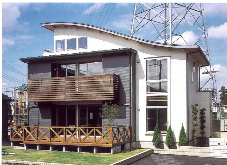
流線形の屋根が印象的な「どんぐりの家」のモデルハウス外観。1階のデッキ、2階のバルコニーにも同社の得意とする木材が使用されている。さわやかな住空間をここで体感することができる