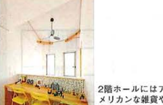
2階ホールにはアメリカンな雑貨や小物を飾るためのカウンターを設定してもらった