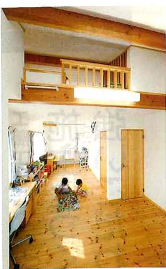
将来2つに仕切れることを想定した子ども部屋。その上には遊び心あふれるロフト空間を設置