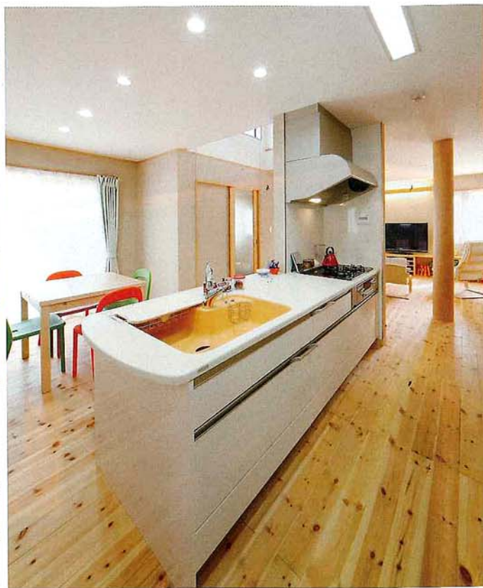
ご夫人が「このメーカーのキッチンでなければイヤ」とこだわったヤマハ製キッチン。カウンターの人造大理石は熱に強く、パンづくりには最適だという（このページの写真は全てT氏邸）