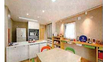
将来のパン教室のため、メモの取れるカウンターなど細かく指示して実現したDKスペース

次世代断熱工法「デコスドライ断熱工法」。繊維系断熱材として防湿層不要の認定を受けている断熱材で、高い断熱性・遮音性・調湿性が魅力。自然素材を使った壁材と併用することで、結露やカビを防ぐ効果も向上。無結露20年保証付というのも嬉しい要素だ。