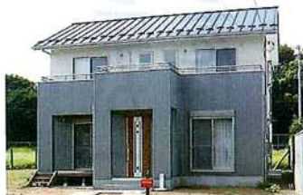
丈夫で軽く、耐候性の高いガルバリウム鋼板とサイディングでメリハリをつけたスタイル