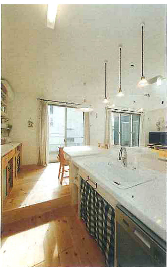
キッチンに立つとリビングにいる家族と目線が合うように、キッチンを一段下げている