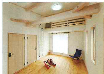
子ども部屋は、将来2部屋に間仕切りできるように、あらかじめドアを2つ設けている