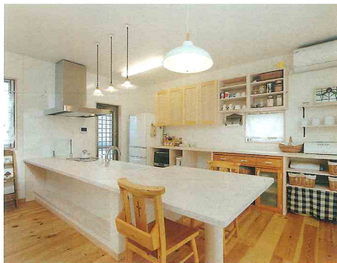
テーブルと一体になったキッチンや背後の棚は全て造作したもの。キッチンをご夫人の要望で白いタイルを貼り、異なったデザインの3つの照明とともにかわいらしさを演出している