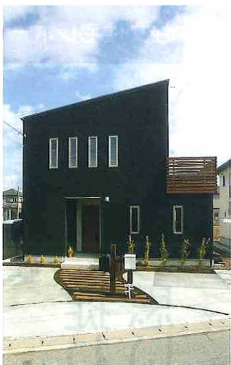
「家の中は妻に任せ、外観は私のこだわりでモダン&スタイリッシュにしました」とSさん