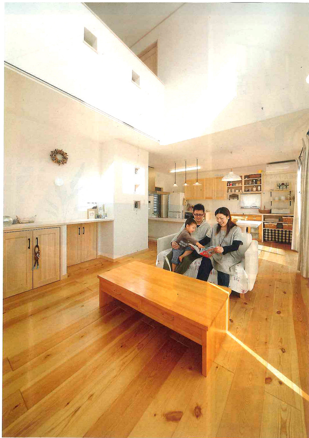
大きな吹き抜けが圧倒的な開放感を演出するLDK。キッチンからはリビング全体を見渡すことができ、吹き抜けを通して、1階と2階のコミュニケーションも良好である。床は無垢のパン材、壁は漆喰で自然素材にこだわった心地よい空間（見開きページの写真は全てS氏邸）