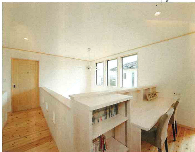
2階ホールには、お子様の勉強などに使うスタディコーナーを造作。高窓からの光は、廊下の壁にある3つの正方形の開口部を通り、左側にある階段部分を明るくしてくれる