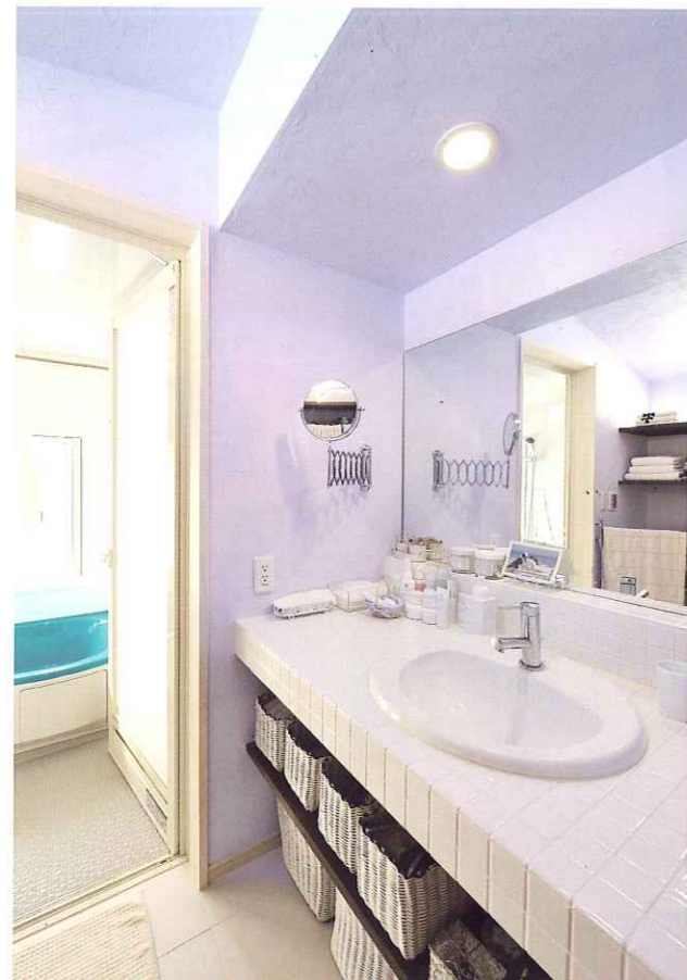
特にこだわったのが洗面台まわり。シンプルでナチュラル。大きめにスペースを取ったので、使い勝手も抜群です。