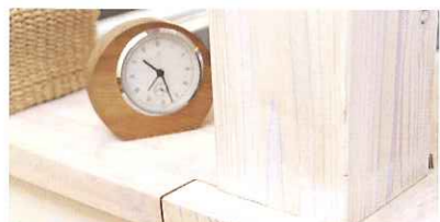
目に見えない構造材にも無垢材を使用。自然素材をふんだんに用いたのは、お子さんに「本物の家」を感じてほしいとの願いも込められています。