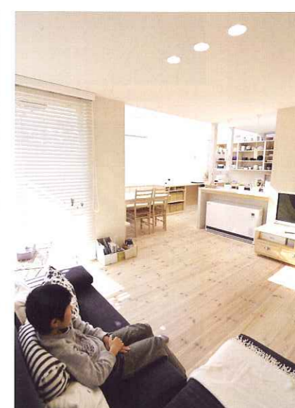
キッチンの正面にはくつろぎのリビング。ダイニングスペースは斜めにちょこんとレイアウトされています。