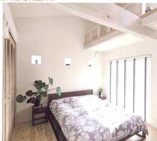
寝室もシンプルでいて開放感いっぱい。収納スペースとしても活躍しそうなロフトから陽の光があふれています。