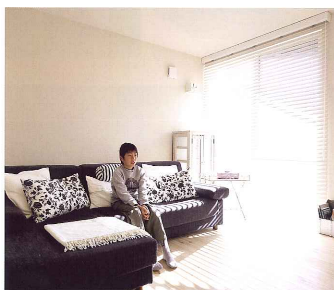
全体的に白を基調とした中、ソファの色味がアクセントとなって、リビングの雰囲気を引き締めています。