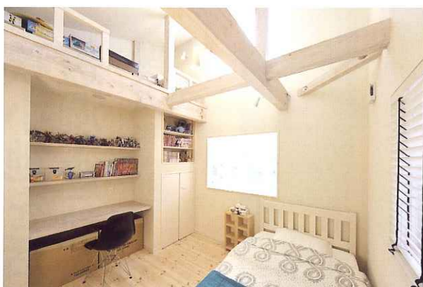
子供部屋にもたっぷりの自然光が。ガラスの入っていない正面窓枠の向こうは吹き抜けの空間。全ての部屋が繋がっています。

様々な仕組みが一体となりエコを実現。 蓄熱式の暖房や「デコスドライ工法」の断熱、オール電化、豊富に取り入れる自然光など、様々な仕組みが一体となったエコ化を実現しています。