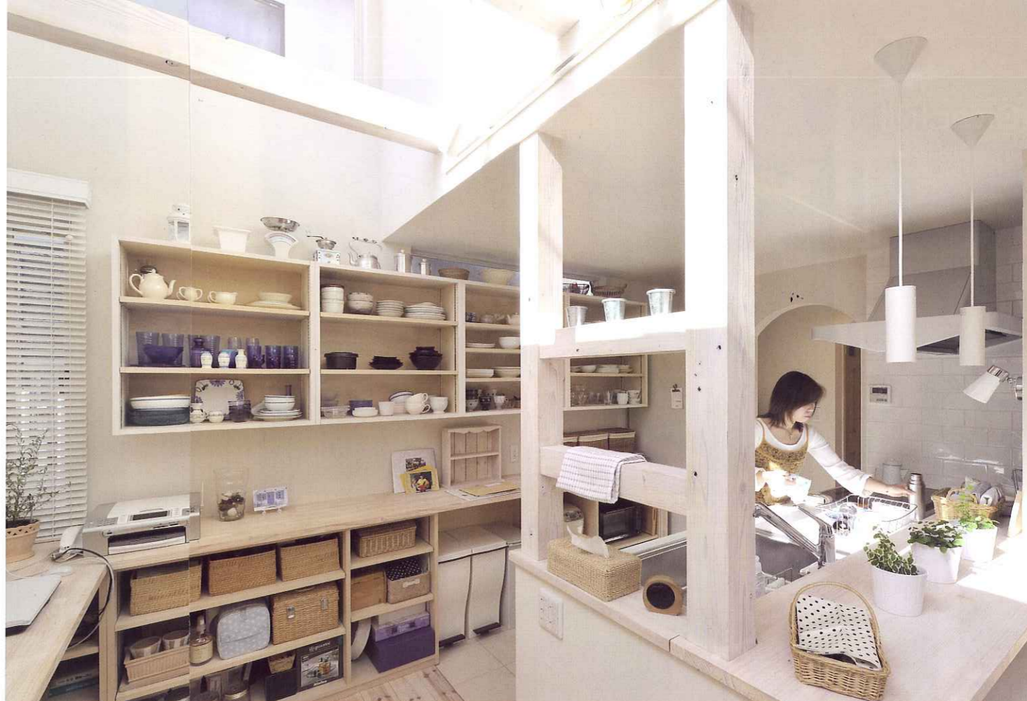
当初、キッチン横の壁予定だったスペースは、施工中にリクエストし、より自然光が入るようデザインを急遽変更していただいたのだそう。